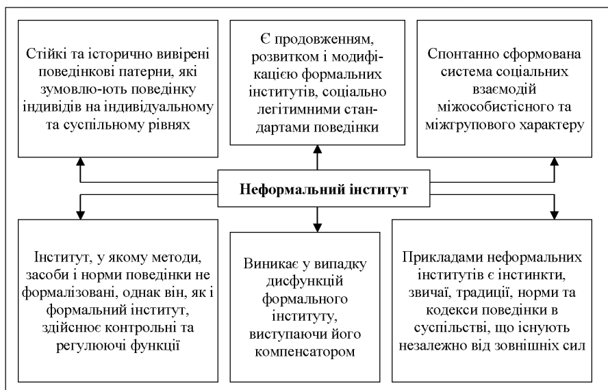
Рис. 1. Сутнісні характеристики неформального інституту (виділені на основі домінуючих підходів інституціональних досліджень)

Дослідження інституціональних трансформацій виявило існування широкого кола витрат, які зумовлюються функціонуванням інституту як механізму впорядкування взаємодії економічних агентів, та включення до спектра трактувань інститутів дослідження їхнього особливого прояву в діапазоні від трансакційних витрат на експлуатацію економічної системи [3, с. 53]; витрат, пов'язаних з пошуком агентом відповідної ціни, організації переговорів та укладанням контрактів;