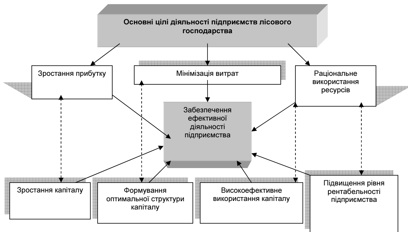
Рис. 3. Роль капіталу в забезпеченні ефективної діяльності підприємств лісового господарства

Основним, на нашу думку, фактором, від якого залежить забезпечення безперервного функціонування підприємств в цілому (в тому числі і підприємств лісової галузі), є раціональне формування та використання капіталу підприємства. Роль капіталу в забезпеченні ефективної діяльності підприємств лісового господарства схематично зобразимо на рис. 3.