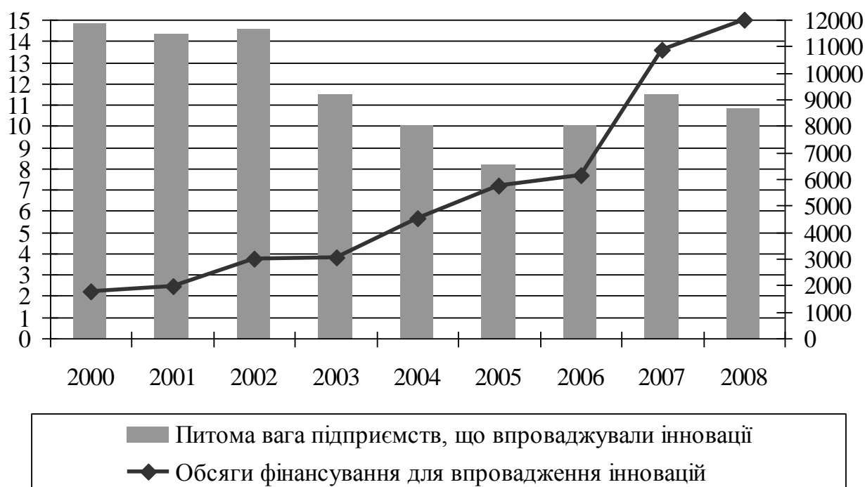
Рис.1. Динаміка ваги підприємств, що впроваджували інновації та обсягів фінансування інновацій в Україні за 2000-2008 рр.

Підтвердженням такого становища є наступні показники в Україні за 2000-2008 роки (рис. 1).