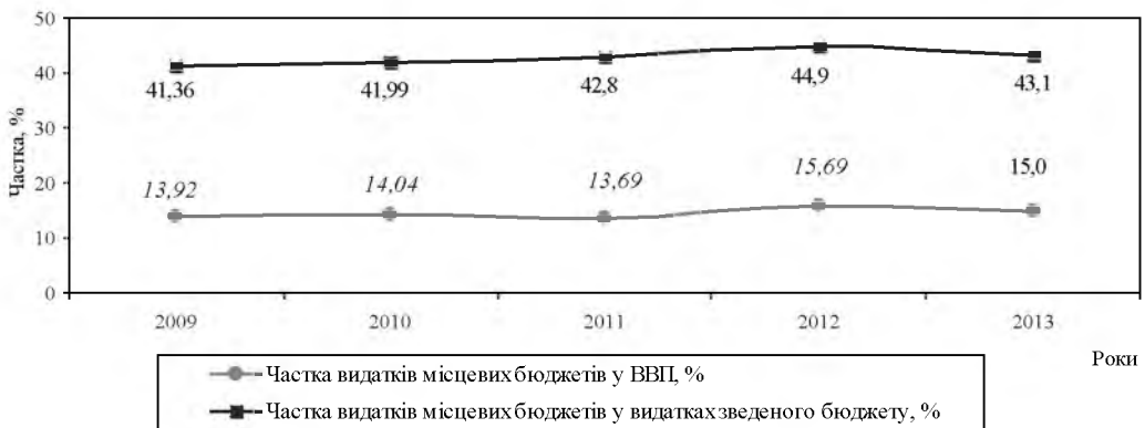
Рис. 1. Динаміка частки видатків місцевих бюджетів України (без урахування міжбюджетних трансфертів) у ВВП та видатках зведеного бюджету у 2009–2013 рр., %.*

– найбільшу питому вагу у видатках місцевих бюджетів України упродовж 2011–2013 рр. займали видатки соціального спрямування – 81,98% (середній показник за три роки), зокрема, на освіту – 32,85%, соціальний захист і соціальне забезпечення – 23,77%, охорону здоров'я – 21,57%, культуру, мистецтво, фізичну культуру, спорт, засоби масової інформації – 3,79%.