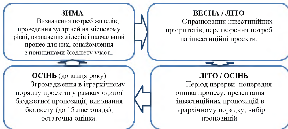
Рис. 4. Зразок циклу бюджету участі [6]

Висновки та перспективи подальших розвідок. Підбиваючи підсумок, слід зазначити, що для ефективного впровадження бюджету участі в Україні необхідне співіснування трьох основних факторів. По-перше, введення цього інструменту вимагає сильної підтримки з боку державних органів влади, яка не блокуватиме громадські ініціативи та процедури і буде готова відмовитися від реалізації частини своїх повноважень на користь громадян. По-друге, ці механізми можуть ефективно функціонувати тільки в громадянському суспільстві, яке хотітиме і матиме реальну можливість брати в них участь. Як видно з практичного досвіду інших країн, безпосередні форми участі громадян у здійсненні влади є найбільш успішними на місцевому рівні, де активно діють неурядові організації та інші громадські рухи. Останнім важливим елементом є наявні фінансові ресурси для реалізації запланованих проектів, відібраних громадянами. Разом з тим, право участі громадян у прийнятті бюджетних рішень може бути реалізоване повною мірою, коли в загальному бюджеті адміністративно-територіальної одиниці буде виділено певну суму бюджетних коштів для виняткового розпорядження громадян.