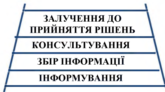
Рис. 1. Драбина громадської участі [3]

Сам діалог влади з громадянами є поступовим, а європейські науковці представляють його за допомогою “драбини громадської участі”, починаючи із зазначення мінімального рівня участі громадян у процесі прийняття публічних рішень і закінчуючи максимально високою участю в цих процесах (рис. 1).