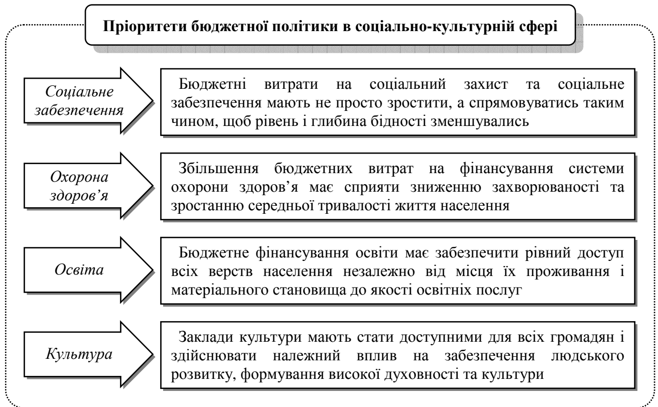
Рис. 3. Пріоритети бюджетної політики в соціально-культурній сфері*

Таким чином, в умовах загострення кризових явищ у вітчизняній економіці, коли відчувається брак ресурсів і важелів впливу на соціально-культурний розвиток регіонів, запропоновані заходи дадуть змогу поліпшити існуючий стан справ. Проте їх імплементація у практичну площину потребує адекватних дій з боку законодавчої та виконавчої гілок влади. Адже в третьому тисячолітті саме соціальні пріоритети у витрачанні фінансових ресурсів мають стати першочерговими напрямками реалізації бюджетної політики на місцевому рівні. Для цього необхідно посилити автономію органів місцевого самоврядування у використанні бюджетних коштів на соціально-культурні заходи, підвищити ефективність муніципального контролю, розширити базу оподаткування прибуткових і майнових податків, а відтак забезпечити їх цільове спрямування на фінансування соціального захисту та соціального забезпечення, освіти, охорони здоров'я, духовного і фізичного розвитку.