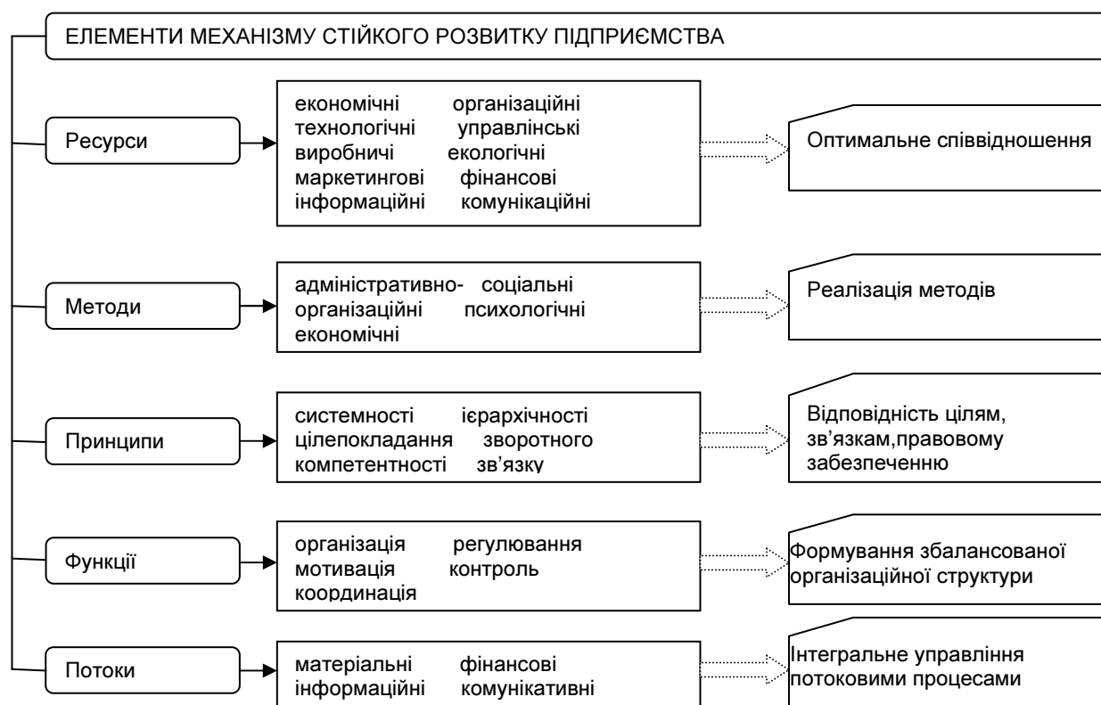
Рис 2. Елементи механізму стійкого розвитку підприємства*

*Примітка: уточнено автором на основі [1, с. 127]