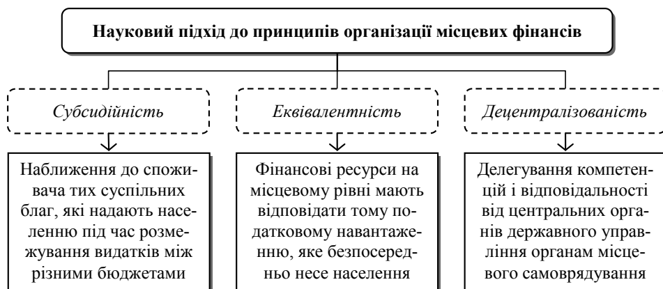
Рис. 3. Науковий підхід до принципів організації місцевих фінансів

Незважаючи на те, який підхід буде застосовано, достатнє фінансове забезпечення місцевого самоврядування – найбільш прагматичний крок на шляху до матеріалізації гарантій суверенітету та побудови демократичної системи влади. За цих обставин ключовим чинником у налагодженні соціально-економічного життя в регіонах має стати ефективне формування системи місцевих фінансів, здатної перетворити територіальні громади із до-