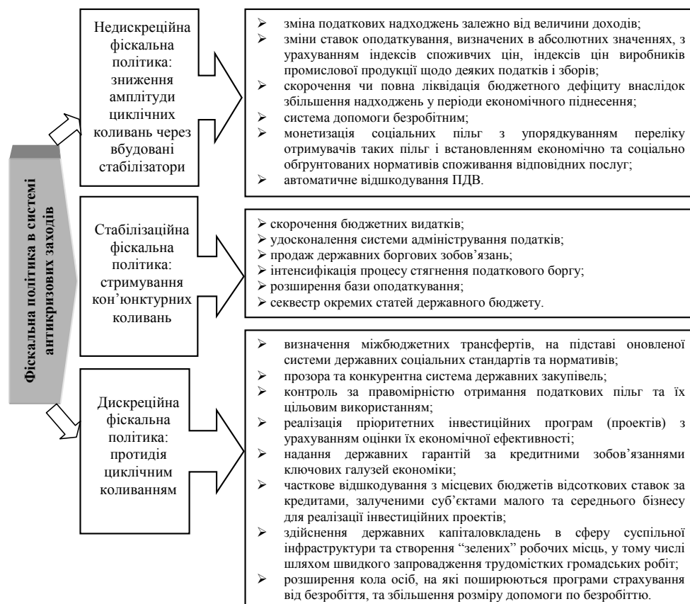
Рис. 1. Фіскальний антикризовий інструментарій в системі економічної політики України

нального ринку та впливу на стан народно-господарської кон'юнктури; перерозподіл національного доходу для розширення споживчого ринку, поліпшення відтворення капіталу; вирівнювання доходів і видатків суб'єктів господарювання і бюджетів різних рівнів; нагромадження необхідних ресурсів для фінансування соціальних програм, ефективного розміщення державних інвестицій у галузях економіки та регіонах; створення централізованого фонду грошових ресурсів держави для виконання її функцій.