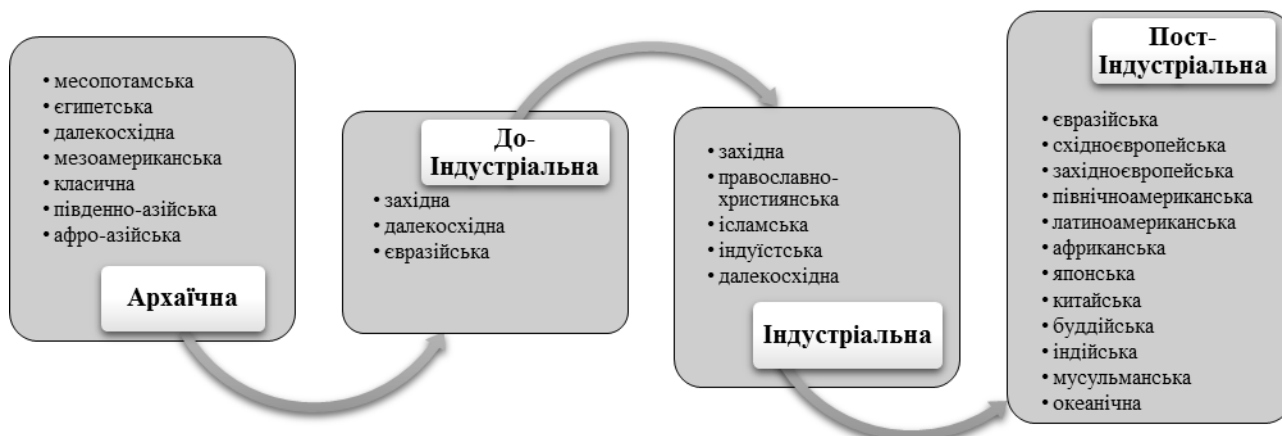
Рис. 3. Фази економічного розвитку цивілізації.

трансформувалися у цивілізації нових поколінь. Експерти виділяють 4 фази економічного розвитку, за якими і класифікують цивілізації (див рис. 3) [12].