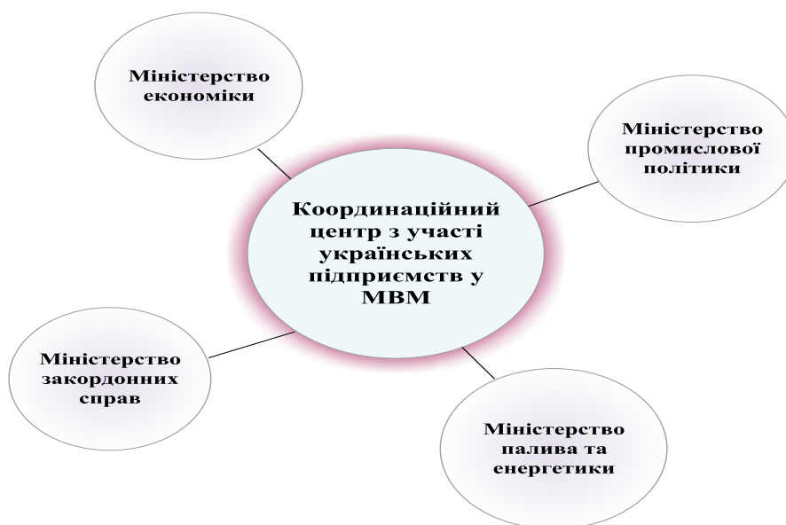
Рис. 3. Схема синхронізації та координації профільних міністерств