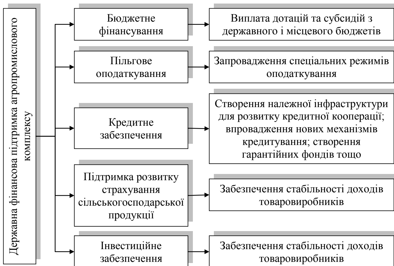
Рис.1. Державна фінансова підтримка агропромислового комплексу України

фінансової підтримки підприємствам агропромислового комплексу у вигляді бюджетного фінансування, пільгового оподаткування, кредитного забезпечення, підтримки розвитку страхування сільськогосподарської продукції та інвестиційного забезпечення, що дає агропромислового комплексу додаткові конкурентні переваги (рис.1).