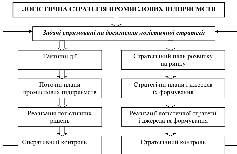
Рис. 1. Принципова схема обґрунтування логістичної стратегії промислових підприємств

зменшення, тобто ліквідації запасів; стратегія скорочення циклу: стратегія диференціації обслуговування клієнта; стратегія кооперації у відносинах “постачальник-споживач”; логістичний outsourcing; стратегія логістичних інновацій.