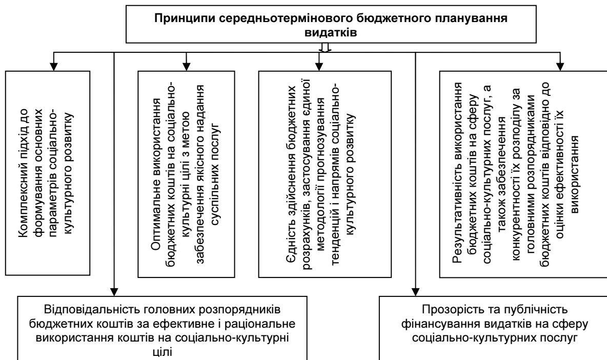
Рис. 1. Принципи організації ефективної моделі середньотермінового бюджетного планування видатків на сферу соціально-культурних послуг*

– розробити організаційний механізм реалізації програмних заходів з метою забезпечення прийняття оптимальних управлінських рішень, спрямованих на вирішення певних завдань за умов мінімізації сукупних ресурсів та досягнення головної мети програми. Перевагами такого механізму є те, що в його межах визначаються виконавці, котрі наділені відповідними повноваженнями та несуть відповідальність за кінцевий результат.