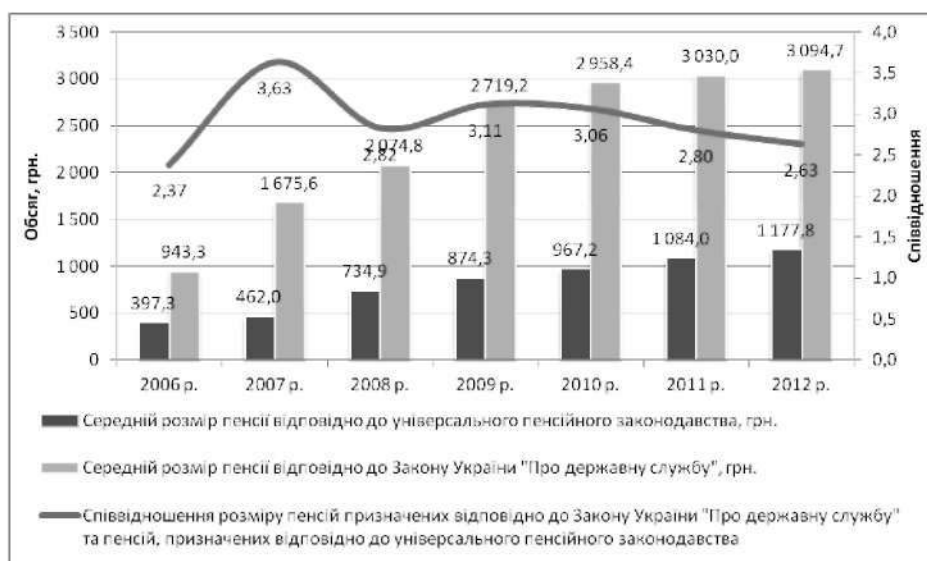
Рис. 4. Динаміка середнього розміру пенсії, призначеного згідно з Законом України "Про державне пенсійне страхування в Україні" та Законом України "Про державну службу", а також їхнє співвідношення у 2006–2012 рр. (станом на 1 січня)*

ної підгрупи та рангу за останньою посадою державної служби [2]. Слід зазначити, що в Законі України "Про загальнообов'язкове державне пенсійне страхування" розмір пенсії визначається шляхом множення заробітної плати на коефіцієнт страхового стажу. Останній розраховується на основі величини оцінки страхового стажу, розмір якого зафіксовано у законодавчому акті на рівні 1,35% [3]. Таким чином, для того, щоб особа, яка виходить на пенсію відповідно до універсального пенсійного законодавства, отримала пенсію у розмірі 80% від заробітної плати, вона повинна мати страховий стаж майже 60 років. Безумовно, що застосування принципово відмінних підходів до визначення розміру пенсій у межах єдиної солідарної пенсійної системи потребує додаткових заходів щодо закріплення різних джерел фінансових ресурсів, необхідних для фінансування пенсійних виплат. В іншому разі, розрахунок розміру пенсій