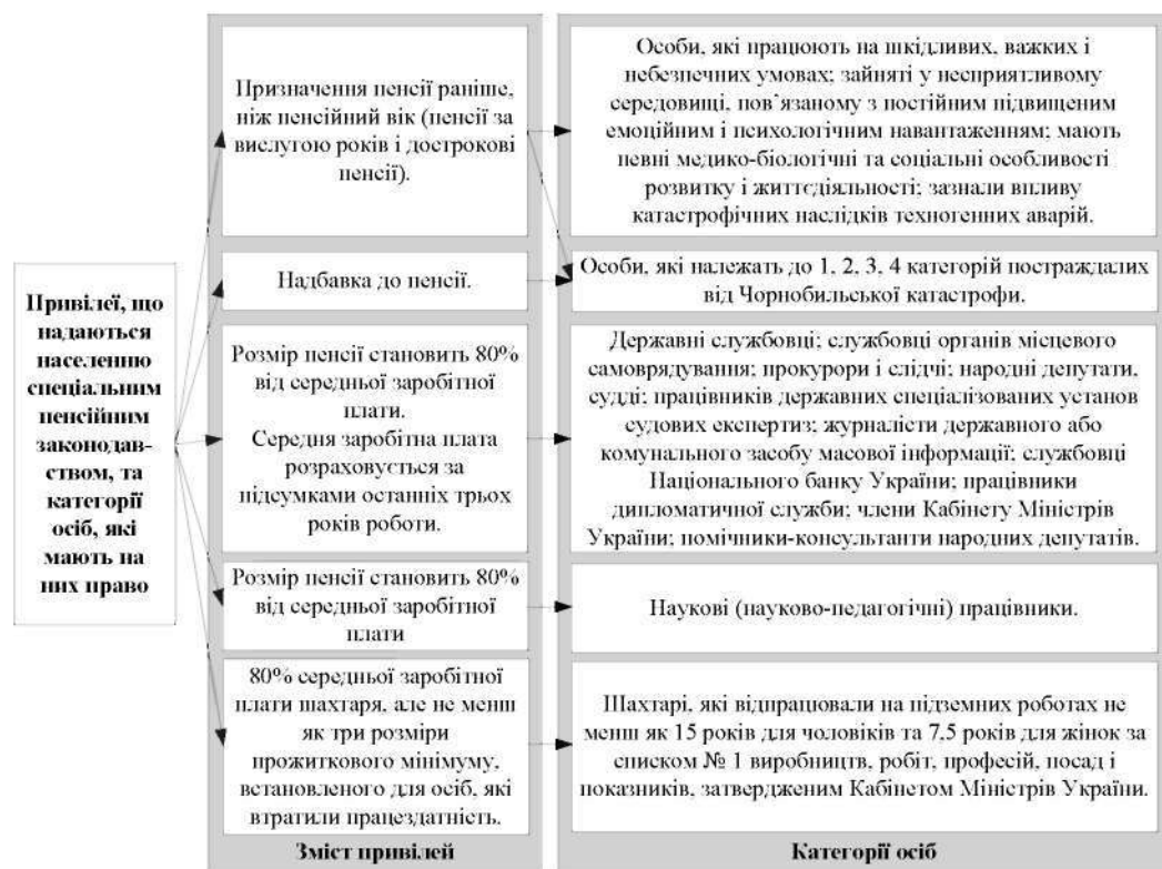
Рис. 1. Зміст основних привілеїв, що надаються населенню у межах спеціального пенсійного законодавства, та категорії осіб, що мають на них право*

Рис. 2 засвідчує, що призначення пенсій для великої кількості населення відбувається на основі окремих законодавчих актів. На початку 2010 р. більше ніж 222 тис. осіб одержували пенсійні виплати з урахуванням вимог норм Закону України “Про пенсійне забезпечення” від 5.11.1991 р. № 1788-XII. Водночас для 75,9 тис. осіб пенсії призначені відповідно до Закону України “Про статус і соціальний захист громадян, які постраждали внаслідок Чорнобильської катастрофи”