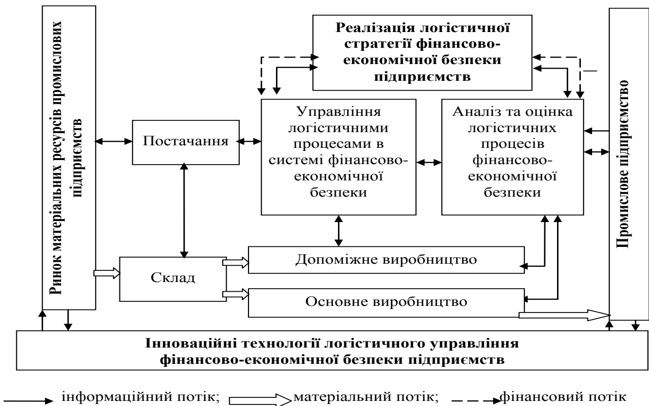
Рис. 2. Формування логістичної стратегії фінансово-економічної безпеки промислових підприємств

Відповідно, запропонували модель логістичної стратегії фінансово-економічної безпеки підприємств, наведену на рис. 2. У даній схемі враховано вплив інновацій та їх застосування в практичній діяльності; це стосується використання нових матеріально-технічних ресурсів, ефективного управління матеріальними, інформаційними, фінансовими потоками, використання надбань науково-дослідних інститутів у промисловості та їх взаємозв'язку. Для промислових підприємств господарчий ланцюжок “закупівля–виробництво–збут” трансформується в ланцюжок “навантаження–перевезення–доставка” (інтеграція функцій). При здійсненні процесів цього ланцюжка зміст відповідних робіт інтегрується так, щоб уможливити розподіл праці та ізольовану адміністративну діяльність, а також повному розподілити послідовність робіт [4, с. 175].