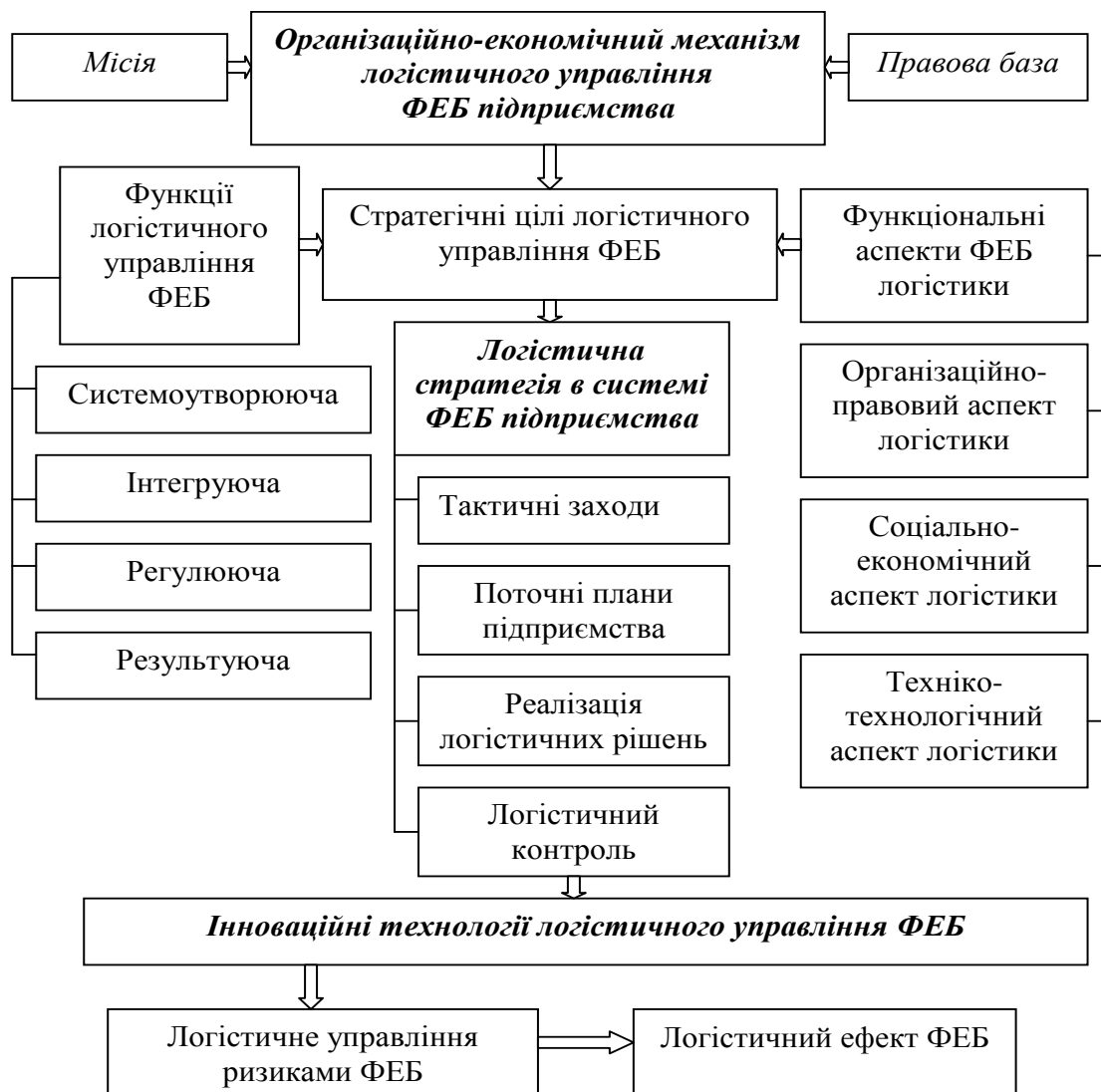
Рис. 4. Організаційно-економічний механізм логістичного управління підприємствами в контексті фінансово-економічної безпеки

Слід зазначити, що організаційно-економічний механізм логістичного управління фінансово-економічною безпекою (ФЕБ) підприємствами забезпечує потрібний набір послуг за максимально можливого зменшення асоційованих витрат, зумовлених виконанням логістичних операцій (рис. 4).