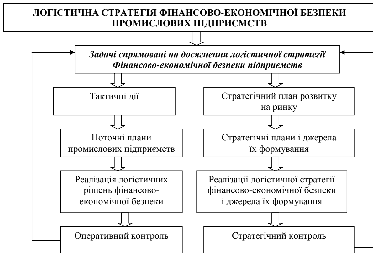
Рис. 1. Принципова схема обґрунтування логістичної стратегії фінансово-економічної безпеки промислових підприємств

диференціації обслуговування клієнта; стратегія кооперації у відносинах “постачальник-споживач”; логістичний outsourcing; стратегія логістичних інновацій.