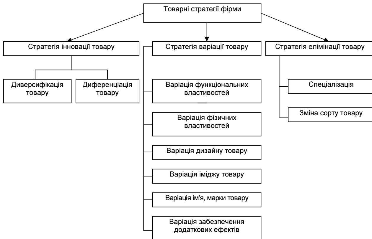
Рис. 1. Товарні стратегії фірми

Товарна стратегія розробляється на перспективу та може включати три стратегічних напрямки щодо покращення привабливості наявного на фірмі товарного міксу: 1) інновація товару; 2) варіація товару; 3) елімінація товару (рис. 1).