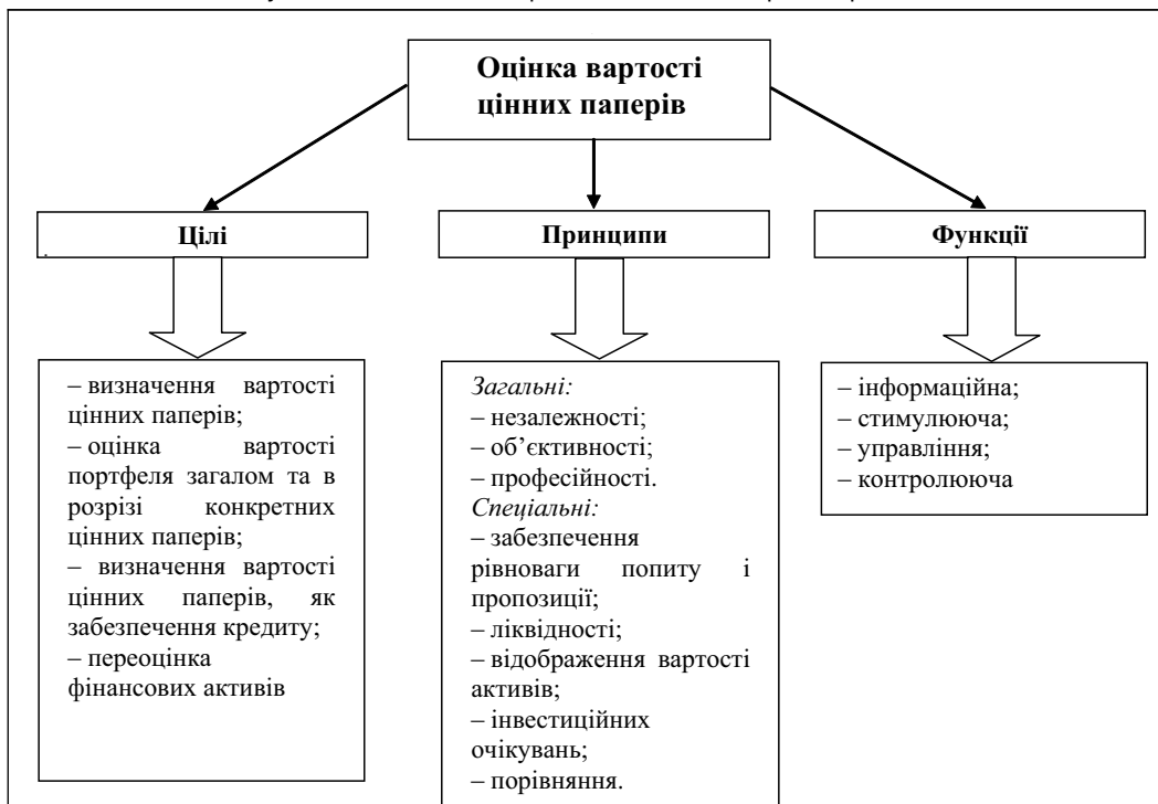
Рис. 1. Цілі, принципи та функції оцінки вартості цінних паперів *

* Систематизовано і побудовано на основі [1, 44–45].