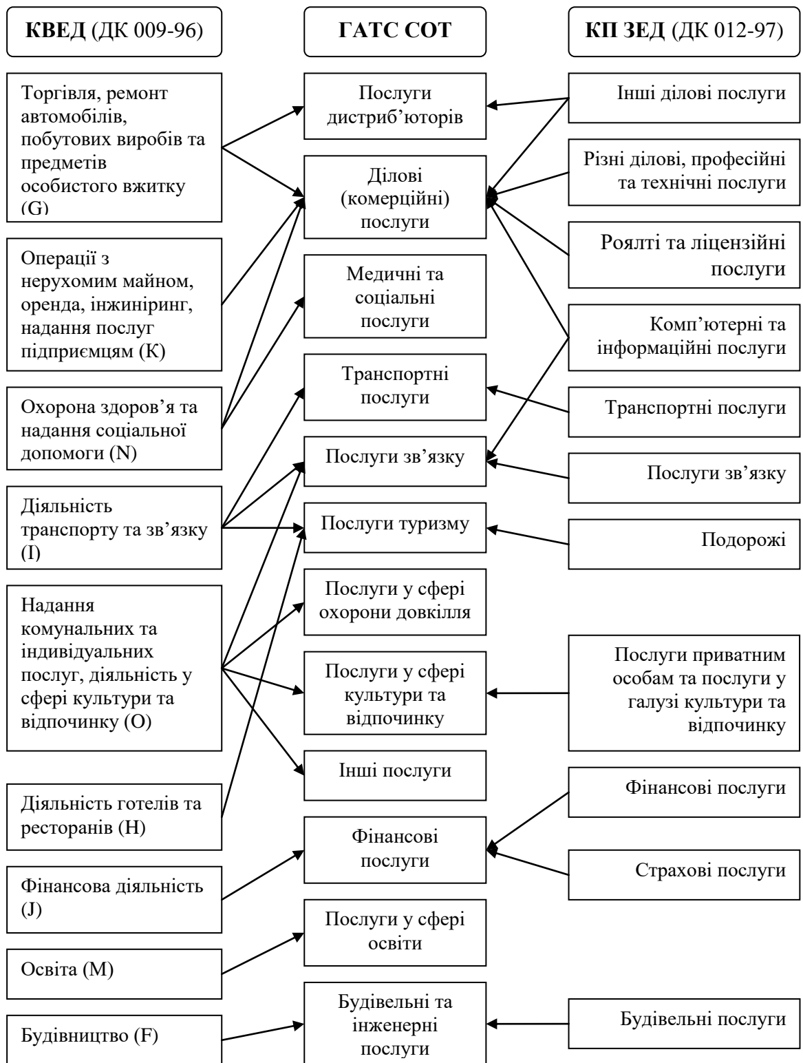
Рис.1. Схема переведення КВЕД та КП ЗЕД до класифікації ГАТС СОТ для статистичної оцінки торгівлі послугами [складено автором]

● чітке визначення кола підприємств, які належать до зарубіжних філій за критерієм власності (володіння контрольним пакетом акцій підприємства єдиним прямим іноземним інвестором, або групою інвесторів, що діють як один), що в