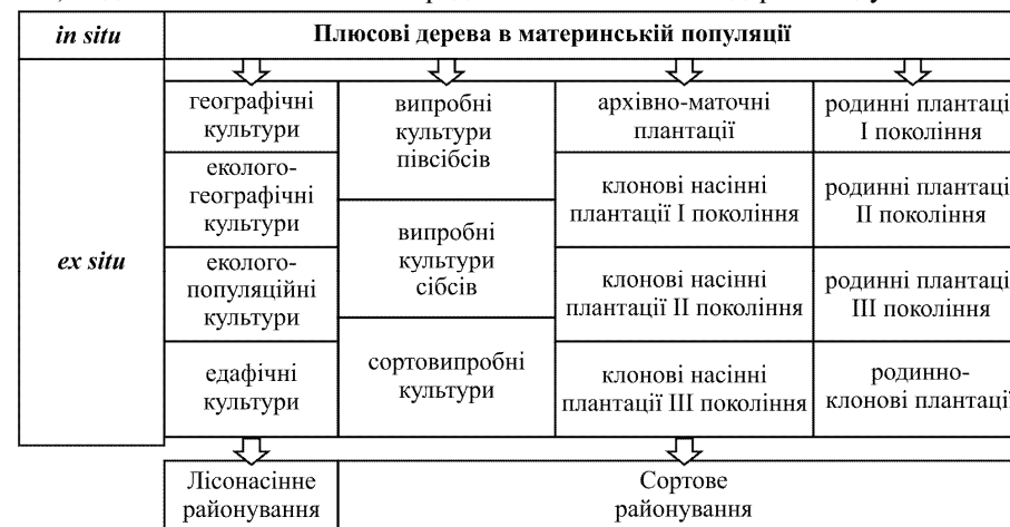
Рис. 2. Зв'язок між плюсовими деревами як об'єктами генозбереження in situ та об'єктами ex situ

му деякі частини лісонасінних районів (зокрема підрайони, наприклад Подільський) недостатньо або зовсім не представлені плюсовими деревами дуба.