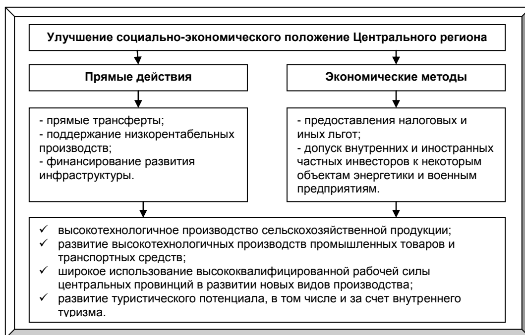
Рис. 1. Приоритеты программы развития центрально региона Китая

Что касается инвестиционной политики столичного региона, то целесообразно рассмотреть динамику инвестирования в Московскую область Российской Федерации. По объемам вложенных в экономику инвестиций Московская область занимает 3 место в России и 2 место в Центральном федеральном округе.