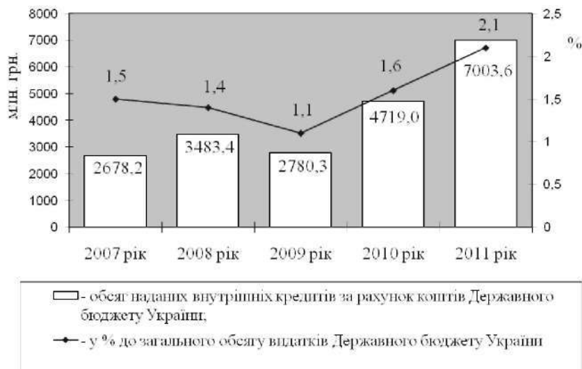
Рис. 1. Динаміка обсягів кредитів, наданих за рахунок коштів Державного бюджету України, та їх відношення до загального обсягу видатків бюджету упродовж 2007–2011 рр.*

Така структура кредитів відповідно до функціональної класифікації, на наш погляд,