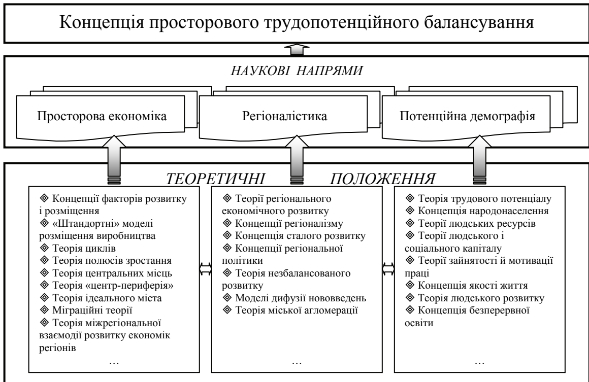
Рисунок 4 - Теоретична основа формулювання положень концепції просторового трудопотенційного балансування

Обґрунтовано необхідність комплексного підходу до теоретико-методологічного обґрунтування пріоритетів розвитку просторових форм організації суспільства на основі ефективного використання трудового потенціалу населення. Основною ідеєю створення сприятливих умов розвитку українського суспільства повинна постати просторова конвергенція умов трудової діяльності, рівня та якості життя населення з оптимальними можливостями використання його трудового потенціалу, в т.ч. на інноваційних засадах у відповідності до функціональності типу поселення. Реалізація такої ідеї вимагає нової філософії сталого розвитку просторових утворень і забезпечення гідного рівня життя людини за місцем її постійного проживання. В основі цієї філософії має лежати новий напрям дослідження сфери соціально-трудових відносин та просторової економіки – трудопотенційне балансування (рис. 4).