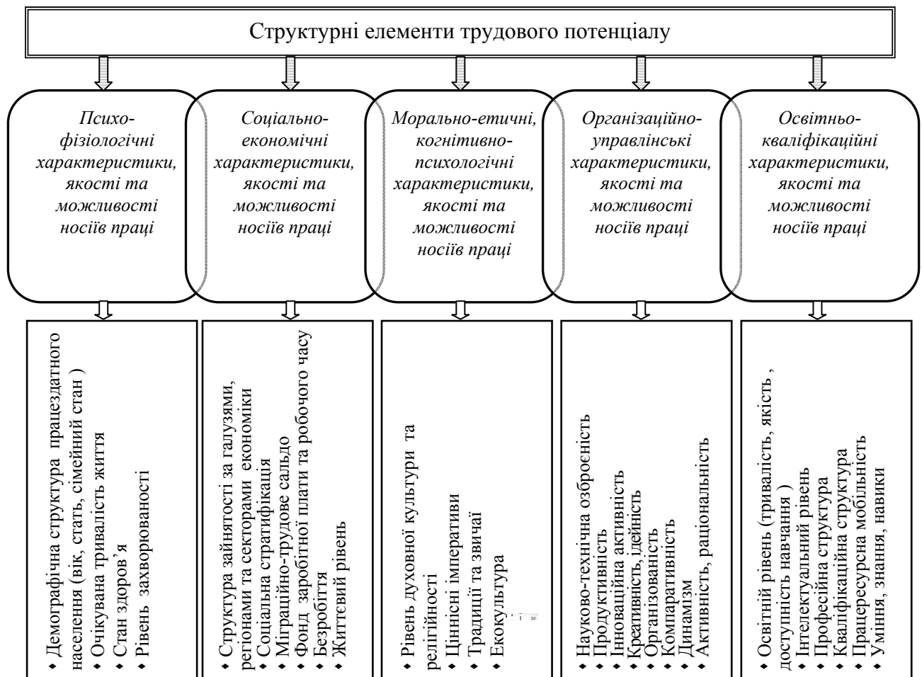
Рисунок 1 - Структура трудового потенціалу: загально-просторовий підхід

Обґрунтування значимості використання трудового потенціалу для розвитку просторових форм організації суспільства потребує деталізації впливу за різними його складовими. У зв'язку з цим представлено авторське бачення структури трудового потенціалу (рис. 1). Вивчення структури потенціалу особливо важливе у розрізі різних типів поселень. Це дозволяє встановити, які його складові використовуються більш ефективно, а які недостатньо.