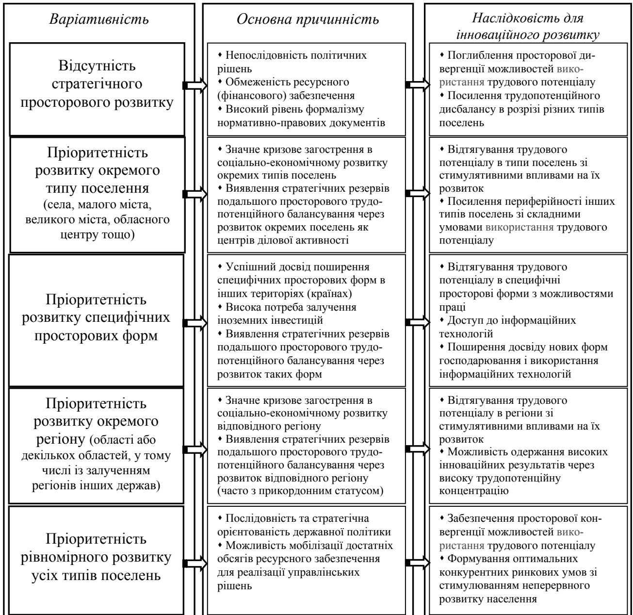
Рисунок 5 - Стратегічна векторність використання трудового потенціалу: просторовий підхід

накопиченням соціального капіталу. Стратегічними цілями при цьому повинні бути: 1) стимулювання ділової активності в просторових формах, що можуть спричиняти відчутний каталізуєчий ефект для розвитку територіально наближених населених пунктів та більш віддалених через адаптацію кращого досвіду; 2) контрольованість процесів просторового трудовотенційного балансування відповідно до перспективних потреб місцевої економіки та ринків праці; 3) стимулювання інноваційної активності із формуванням нового типу працівника з високими характеристиками. Відповідно до кожної стратегічної цілі визначено територіальну специфікацію її досягнення – для обласного центру, великого, малого міста, селища міського типу, села.