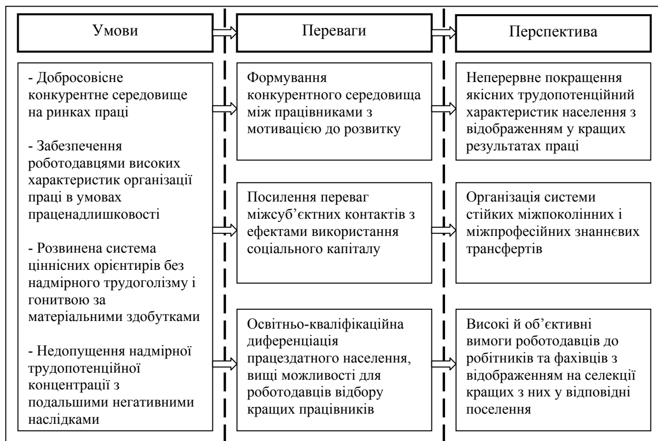
Рисунок 6 - Переваги трудовотенційної концентрації населення в міських поселеннях

інституціоналізованих проблем на рівні міст. Не можна пріоритетно стимулювати зайнятість та ділову активність на сільських територіях, якщо для міст характерні численні проблеми продуктивної зайнятості, інноваційної активності, захисту трудових прав, законності тощо.