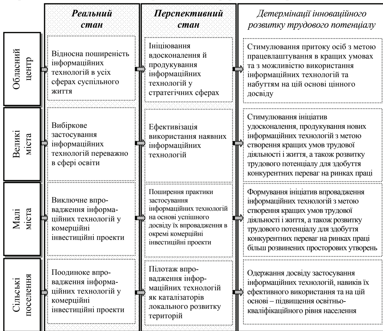
Рисунок 3 - Територіальна специфіка застосування інформаційних технологій у контексті їх впливу на трудовий потенціал різних типів поселень

що часто веде до ресурсної диференціації та можливостей розвитку декількох видів економічної діяльності; первинного обрання в моноцентричному центрі пріоритетного виду економічної діяльності, що вирізняється високою галузевою суміжністю з каталізуючим ефектом для розвитку інших сфер; активної політики перекваліфікації концентрованих тут осіб з відповідними потенційними характеристиками, у тому числі зі стимулюванням їх підприємницької активності у привабливих сферах господарювання.