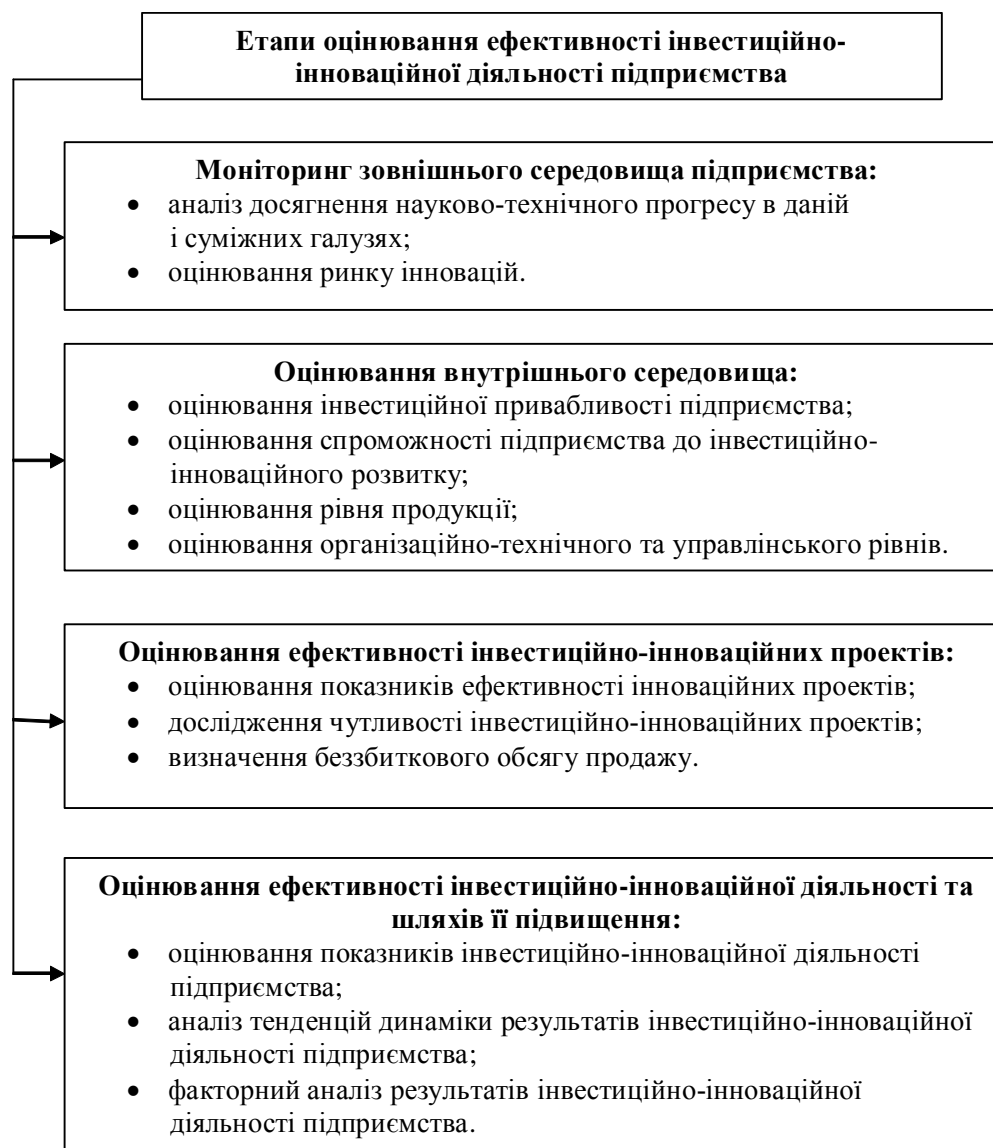
Рис. 1. Етапи оцінювання ефективності інвестиційно-інноваційної діяльності підприємства

інновації як цінність, що має бути корисною і потрібною, тобто відповідати певним вимогам із боку як підприємства, котре ініціює її запровадження, так і з боку споживачів цієї інновації [9, с. 171].