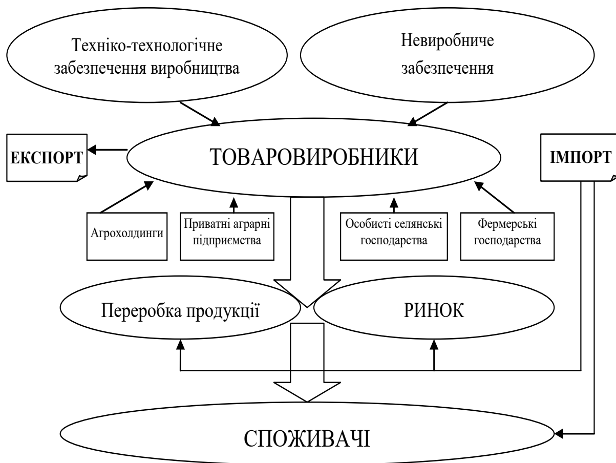
Рис. 2. Організаційна модель конкурентоспроможного розвитку м'ясного скотарства України

Виявлено, що у процесі сільськогосподарського виробництва між суб'єктами господарювання встановлюються певні економічні відносини, що за своєю суттю є сукупністю різних елементів ринкової економіки. Галузь м'ясного скотарства, як складова частина національної економіки, розвивається під дією об'єктивних законів ринку. Важливу роль у цьому процесі відіграє конкуренція, яка зумовлює динамічний розвиток економічних процесів і тісно пов'язана з ціною, попитом і пропозицією.