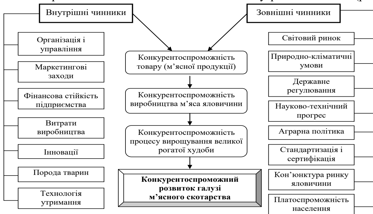
Рис. 1. Чинники конкурентоспроможного розвитку галузі м'ясного скотарства

Постановка питання про необхідність оцінки конкурентоспроможного розвитку галузі на різних рівнях національної економіки зумовлена динамічними властивостями її складових: підприємств, інфраструктури та інститутів управління. Усе це дало змогу виокремити низку зрізів оцінювання конкурентоспроможного розвитку окремої галузі – м'ясного скотарства. Конкурентоспроможний розвиток галузі м'ясного скотарства визначається низкою зовнішніх і внутрішніх чинників (рис. 1).