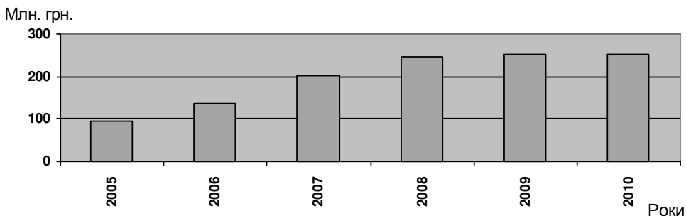
Рис. 1. Обсяги фінансування фундаментальних та прикладних досліджень ВНЗ із загального фонду Державного бюджету України

Доцільно зазначені достатньо високі темпи приросту видатків на наукову та науково-технічну діяльність ВНЗ у попередні роки зберегти і в майбутньому.