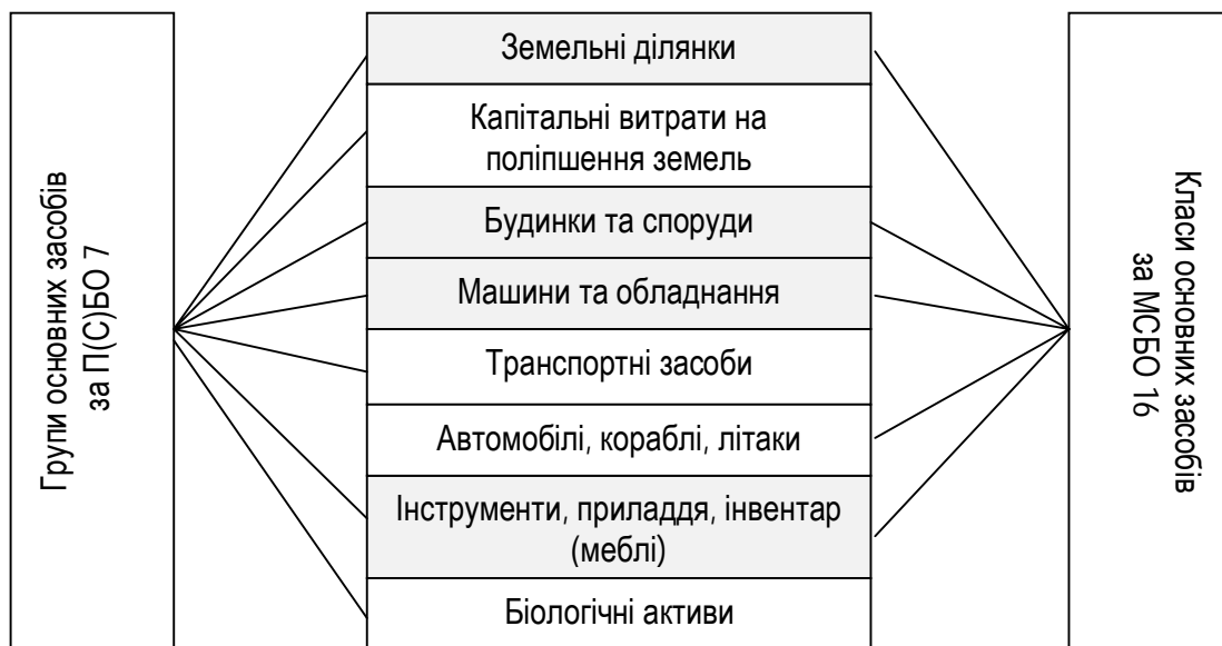
Рис. 1. Класифікація об'єктів основних засобів за П(С)БО та МСБО*

Аналізуючи національні та міжнародні стандарти щодо обліку основних засобів спостерігаються як спільні риси (виділено кольором), так і відмінності в класифікації (рис. 1).