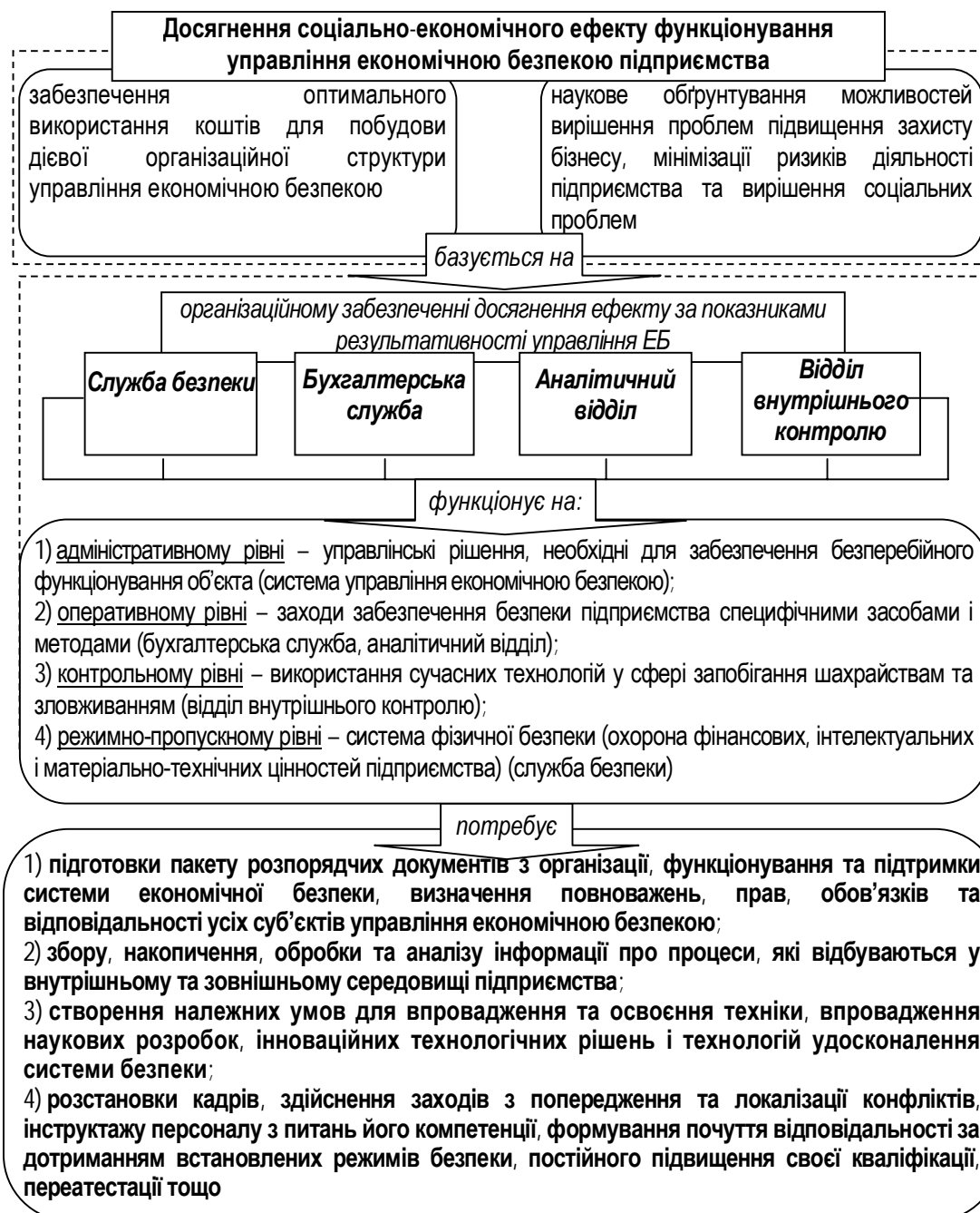
Рис. 2. Забезпечення досягнення соціально-економічного ефекту функціонування інтегрованої системи управління економічною безпекою підприємства

Для забезпечення дієвого контролю за виконанням своїх обов'язків співробітниками базового блоку управління економічною безпекою підприємства важливим інструментом виступає розробка Регламенту з економічної безпеки суб'єкта господарювання, Посадові інструкції працівників з реалізації управління економічною безпекою підприємства; Положення про комерційну таємницю та конфіденційну інформацію. Таким чином, підвищується суспільна роль працівників підприємства, залучених до реалізації завдань інтегрованої системи управління економічною безпекою, та регулювання їх правового статусу в частині захисту інформації та бізнесу в цілому.