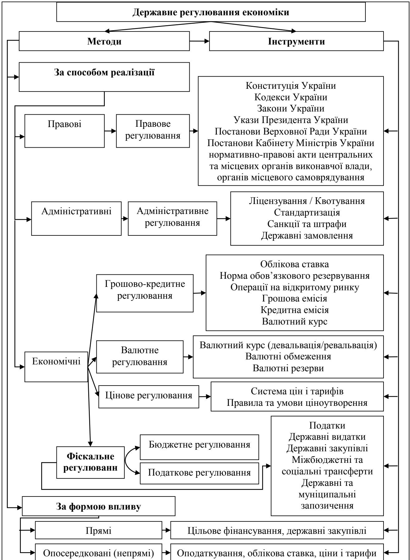
Рис. 1. Місце фіскального регулювання в системі методів державного регулювання економіки