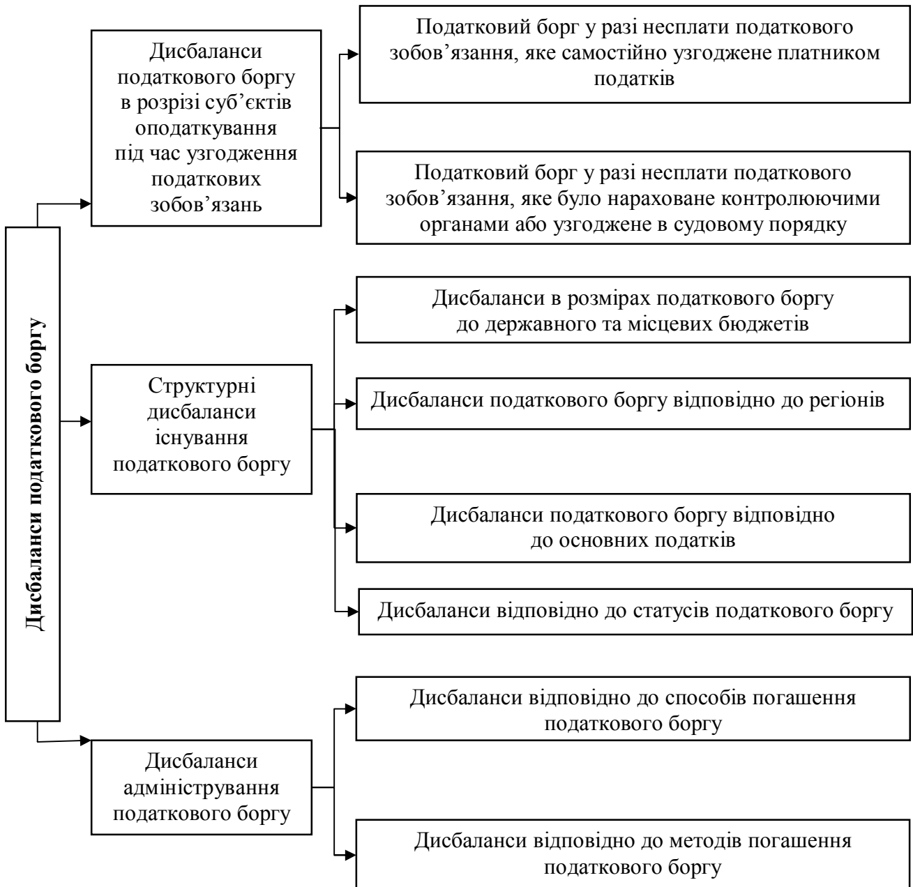
Рис. 1. Дисбаланси податкового боргу та їх структуризація

Водночас з'ясовано, що дисбаланси податкового боргу не є абстрагованим явищем, а перебувають у тісній взаємодії з процесом функціонування національної економіки. З одного боку, наявність значних розмірів податкового боргу неодмінно впливає на такі макроекономічні показники, як доходи та видатки бюджету, ВВП, сукупний попит і пропозиція. З іншого боку, порушення зазначених показників відповідно позначається на утворенні та зростанні обсягу податкового боргу в державі. Дослідження взаємозв'язку і взаємозалежності між макроекономічною стабільністю та дисбалансами податкового боргу свідчить, що вплив макропоказників на сплату податкових зобов'язань є прямим або опосередкованим. Напрямку порушення макроекономічної стабільності впливає на виникнення