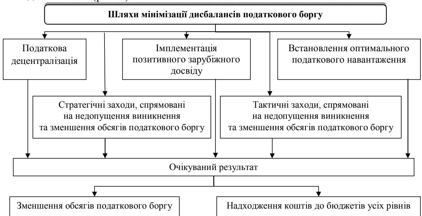
Рис. 4. Структурно-логічна модель зменшення обсягів податкового боргу через мінімізацію його дисбалансів

Загалом проведені дослідження дали можливість запропонувати науково-теоретичні підходи щодо визначення оптимальних інструментів скорочення податкового боргу, які загалом окреслені в структурно-логічній моделі мінімізації його дисбалансів. (рис. 4).