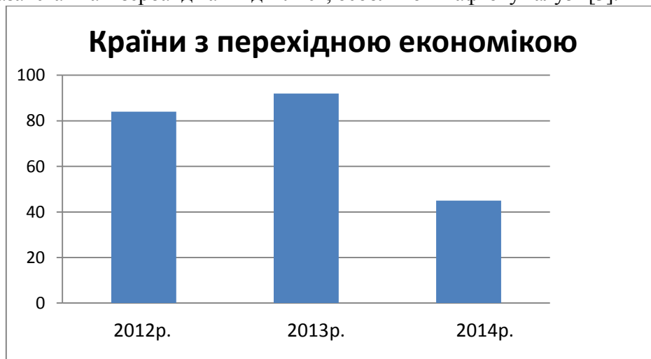
Рис.3. Надходження ПІІ в країни з перехідною економікою в 2012–2014рр., млрд. дол. США. [3]

експертів приплив ПІІ в Російську Федерацію скоротився на 70%, його приблизна кількість оцінюється в 19 млрд. дол. США. Великі нафтові та газові компанії, що базуються в розвинених країнах утрималися від інвестицій в РФ. В Україні потоки ПІІ також мають тенденцію до зниження, за рахунок конфлікту з РФ. На відміну від Росії та України, потоки іноземного капіталу в Казахстан та Азербайджан піднялися, особливо в нафтову галузь [3].