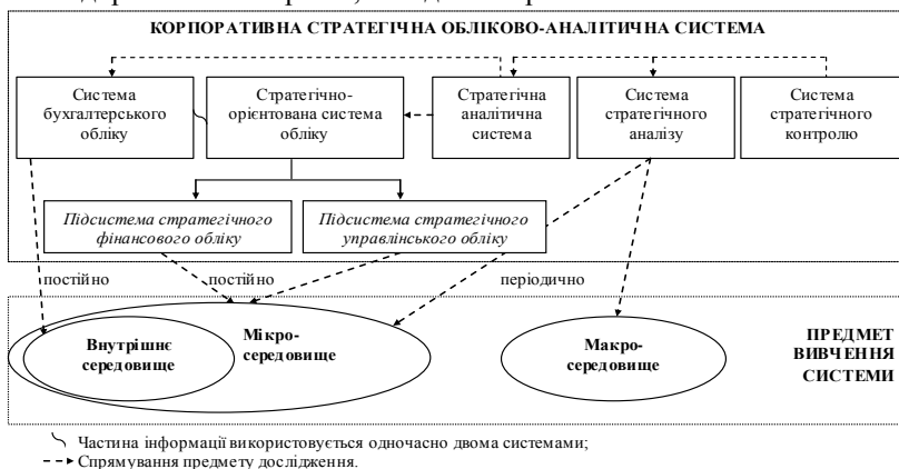
Рис. 2. Структура корпоративної стратегічної обліково-аналітичної системи

стану побудови системи стратегічного обліку на сільськогосподарських підприємствах України, наведена на рис. 2.