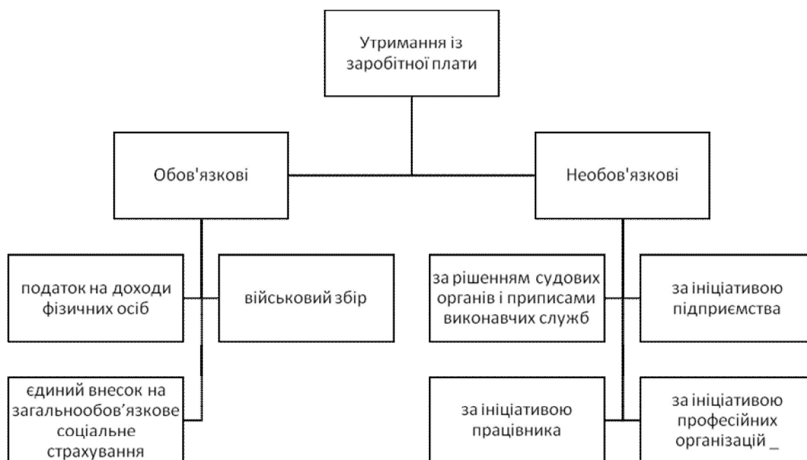
Рис 3.1. Види утримань із заробітної плати

Із сум нарахованої заробітної плати членів трудового колективу, осіб, що працюють на підприємстві за трудовими угодами, договорами підряду, за сумісництвом, виконують разові роботи, здійснюються різноманітні утримання. Їх поділяють на обов'язкові та необов'язкові (рис. 3.1).