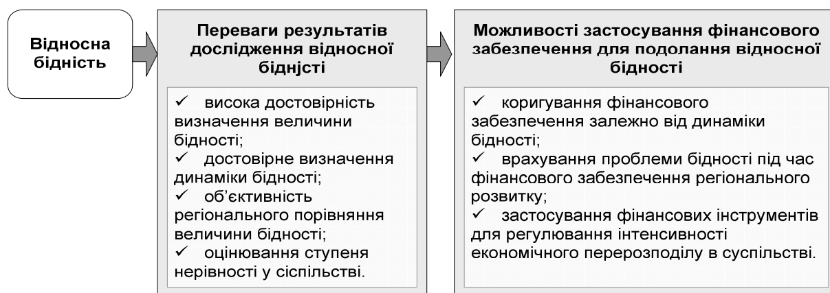
Рис. 2. Специфіка використання фінансового забезпечення для зниження відносної бідності

За результатами дослідження цього аспекту бідності можна одержати важливу інформацію про величину бідності, динаміку бідності та регіональні відмінності її показників, а також про ступінь нерівності у суспільстві (рис. 2).