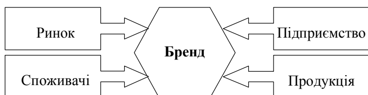
Рис. 2. Ключові групи чинників, що впливають на формування бренду

Формування бренду – багаторівневий і складний процес, під час реалізації якого потрібно врахувати багато чинників. Їхній перелік є досить специфічним для кожного підприємства, але можна виокремити групи чинників, що їх треба аналізувати в будь-якому разі (рис. 2).