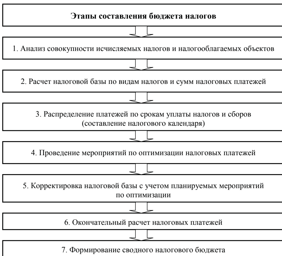
Рис. 2. Последовательность этапов составления бюджета налогов

Общий порядок действий при составлении бюджета налогов на планируемый период включает в себя несколько этапов, последовательность выполнения которых представлена на рис. 2.