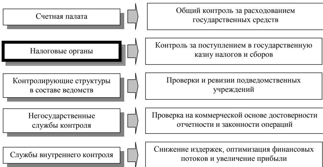
Рис. 1. Элементы системы финансового контроля в развитых странах

Как видно из рис. 1, сферой финансового контроля являются практически все операции, совершаемые с использовани-