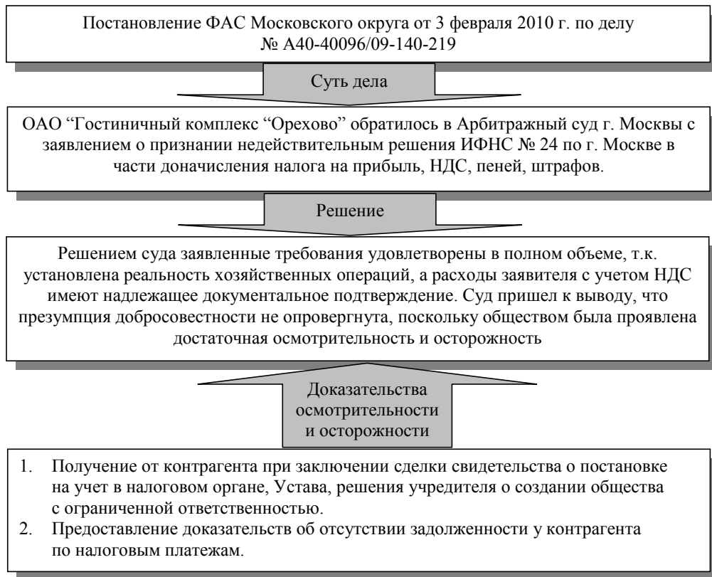
Рис. 3. Пример 2 по доказательству налогоплательщиком должной осмотрительности и осторожности

– отменить решение и прекратить производство по делу о налоговом правонарушении;