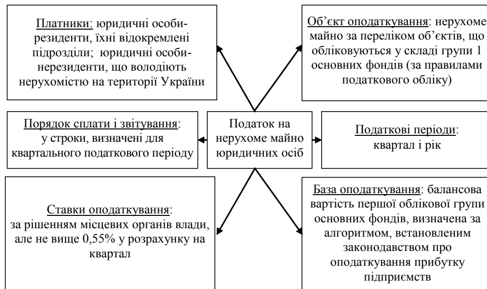
Рис. 1. Основні елементи податку на нерухоме майно юридичних осіб

Стосовно ж податку на нерухоме майно фізичних осіб, то головною проблемою на шляху його запровадження в Україні є оцінка бази оподаткування. Найпростішим варіантом її вирішення є