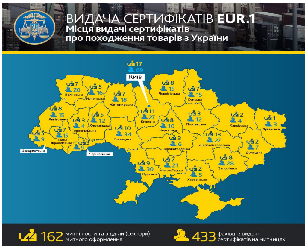
Рис. 2. Місця видачі сертифікатів з перевезення форми EUR.1