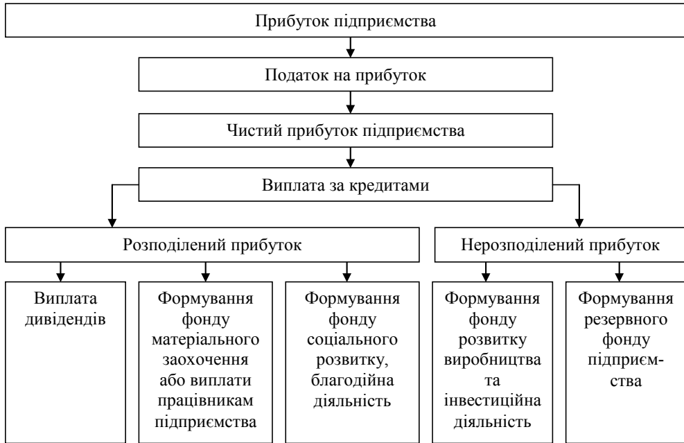
Рис. 2. Загальна схема розподілу прибутку підприємства

виплату дивідендів та на інші цілі. Відрахування на формування вказаних фондів підприємство здійснює лише у тому випадку, якщо їхнє створення передбачено установчими документами. При цьому прибуток, спрямований на поповнення статутного капіталу, може використовуватись для збільшення майна підприємства за рахунок фінансування будівництва (виготовлення, придбання) об'єктів виробничого та невиробничого призначення, що вводяться в експлуатацію, придбання техніки, обладнання й інших основних засобів фінансування приросту оборотних активів тощо.