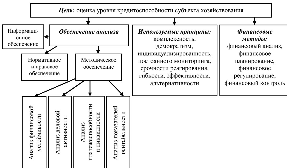
Рис. 1. Система оценки уровня кредитоспособности

уровня кредитоспособности, а также совокупность информационного, методического, нормативного и правового обеспечения (рис. 1).