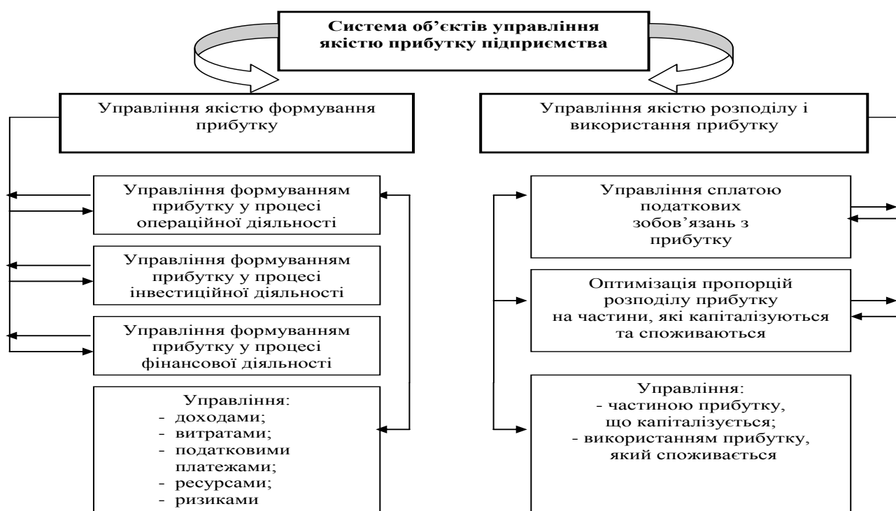
Рис. 2. Схема багатоступеневої функціональної системи об'єктів управління якістю прибутку підприємства

Доведено, що управління величиною та якістю прибутку від операційної, інвестиційної, фінансової діяльності підприємства відображає сукупність взаємопов'язаних процесів планування, прогнозування, аналізу, організації, мотивації, контролю, які забезпечують реалізацію стратегії і тактики управління прибутком на етапах його формування, розподілу й використання та здійснюється на основі принципів системності, науковості, цілеспрямованості, комплексності, ієрархічності, взаємозв'язку, інноваційності, процесного підходу тощо (рис. 2).