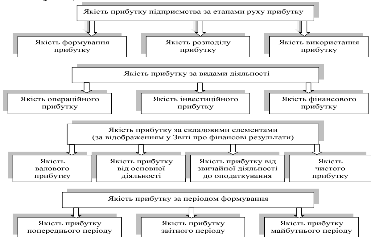
Рис. 1. Класифікація якості прибутку підприємства

Розроблено класифікацію якості прибутку, яка сприятиме глибшому розумінню призначення та функціональної ролі якості прибутку як об'єкта управління (рис. 1).