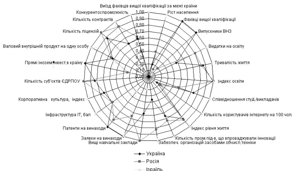
Рис. 3. Загальна порівняльна пелюсткова діаграма інтелектуального капіталу

У пелюстковій діаграмі відображені нормалізовані дані аналітичних даних відповідно до складових структури інтелектуального капіталу [1, 3].