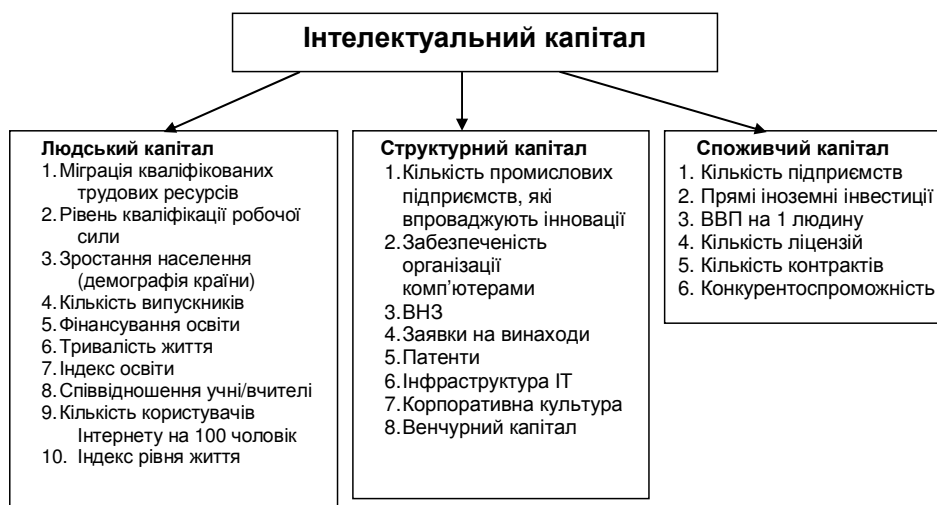
Рис. 1. Структура інтелектуального капіталу

Для того, щоб оцінити рівень інтелектуального потенціалу держави, необхідно визначити рівень людського, структурного (організаційного), маркетингового потенціалів та визначити їхні структурні недоліки і переваги з метою подальшого його використання для розробки стратегії розвитку корпорацій та інших підприємств.