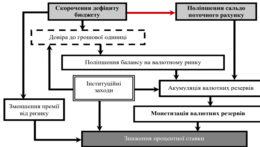
Рис. 1. Механізм зниження процентної ставки

Так, внаслідок скорочення дефіциту бюджету поліпшується сальдо поточного рахунку платіжного балансу, відбувається зменшення премії від ризику та підвищення довіри до грошової одиниці. За таких умов слід очікувати на поліпшення балансу купівлі-продажу іноземної валюти. В поєднанні з поліпшенням сальдо поточного рахунку виникають передумови для нарощування валютних резервів. Подальше збільшення грошової маси внаслідок монетизації додатного сальдо поточного рахунку сприятимуть зниженню процентної ставки — на додаток до зниження премії від ризику. Інституційні заходи на зразок ефективної профілактики корупційних дій, зміцнення судової системи, лібералізації адміністративних регуляторів тощо видаються важливими для підсилення довіри до грошової одиниці, а головним чином з метою створення передумов для припливу довгострокового капіталу, що прискорить акумуляцію валютних резервів і одночасно створить передумови для надійного поліпшення сальдо зовнішньої торгівлі за рахунок зміцнення експортного сектора та економічно доцільного імпортозаміщення.