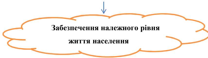
Рис. 2.1. Основні реформи бюджетної децентралізації [9].