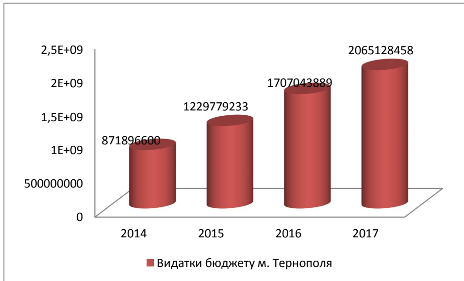
Рис. 2.3. – Динаміка видатків бюджету м. Тернополя протягом 2014 – 2017 рр., грн.[21]

Отож, варто відзначити, що результатом децентралізації є передача значних повноважень з розподілу бюджетних коштів на місцевий рівень, завдяки чому, можна якомога ефективніше розподілити дані фінансові ресурси та забезпечити потреби суспільства у даному регіоні.