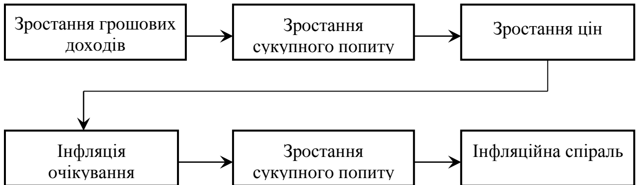
Рис.1.2 Процес появи і поглиблення інфляції

Інфляція може протікати у таких формах [5]: