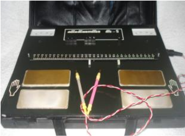
Рис. 1. Пристрій “Активациометр АЦ-5”

д) координацію й асиметрію рухових функцій, е) здатність індивіда до сприйняття просторових відрізків (окомір). Основним індикатором психоемоційного стану, який безпосередньо пов’язаний з активацією півкуль головного мозку, є сумарний показник рівня функціонування правої й лівої півкулі.