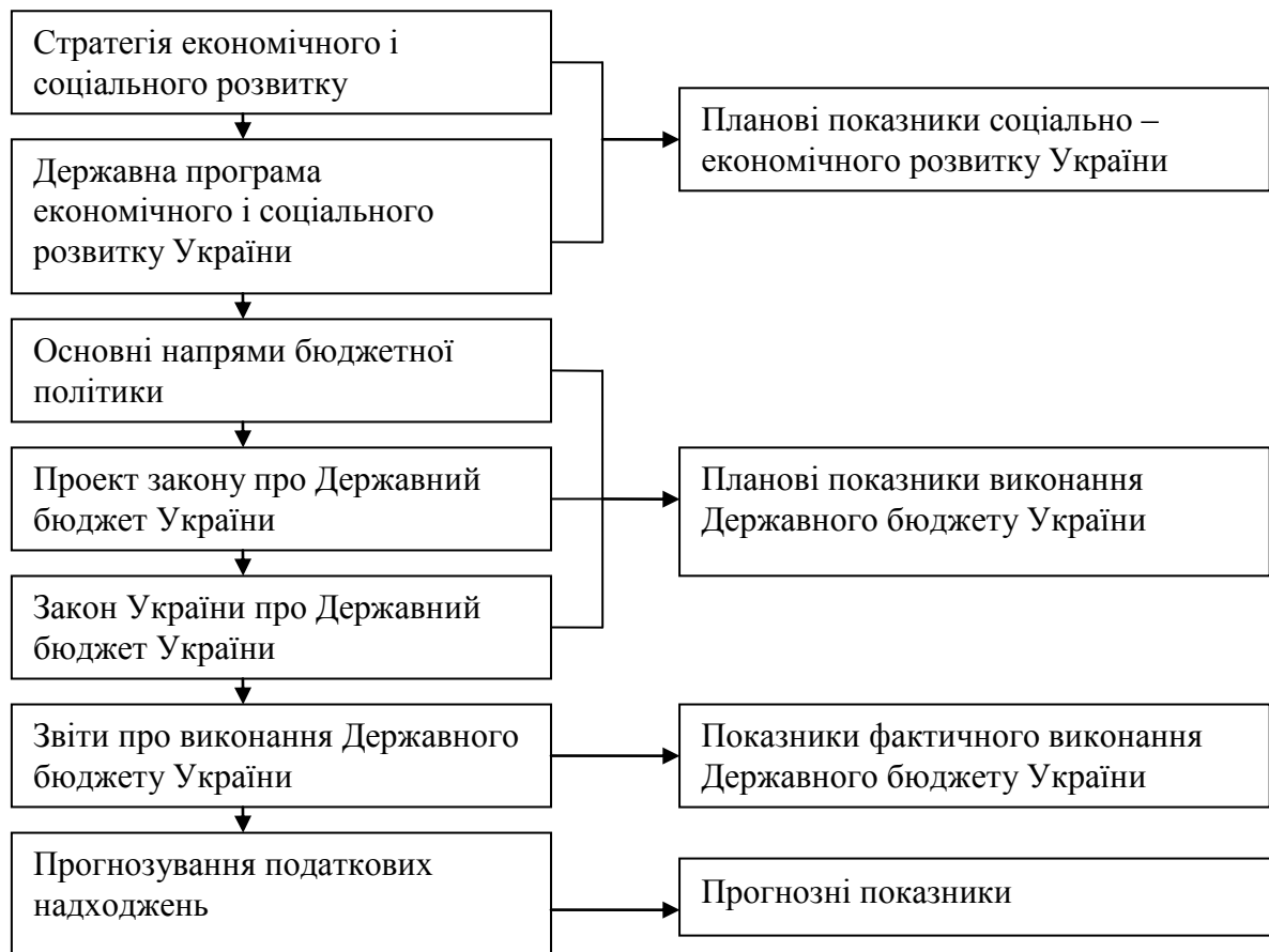
Рис. 1. Процес формування системи статистичних показників податкових надходжень до бюджету*

* Складено автором з урахуванням етапів бюджетного процесу