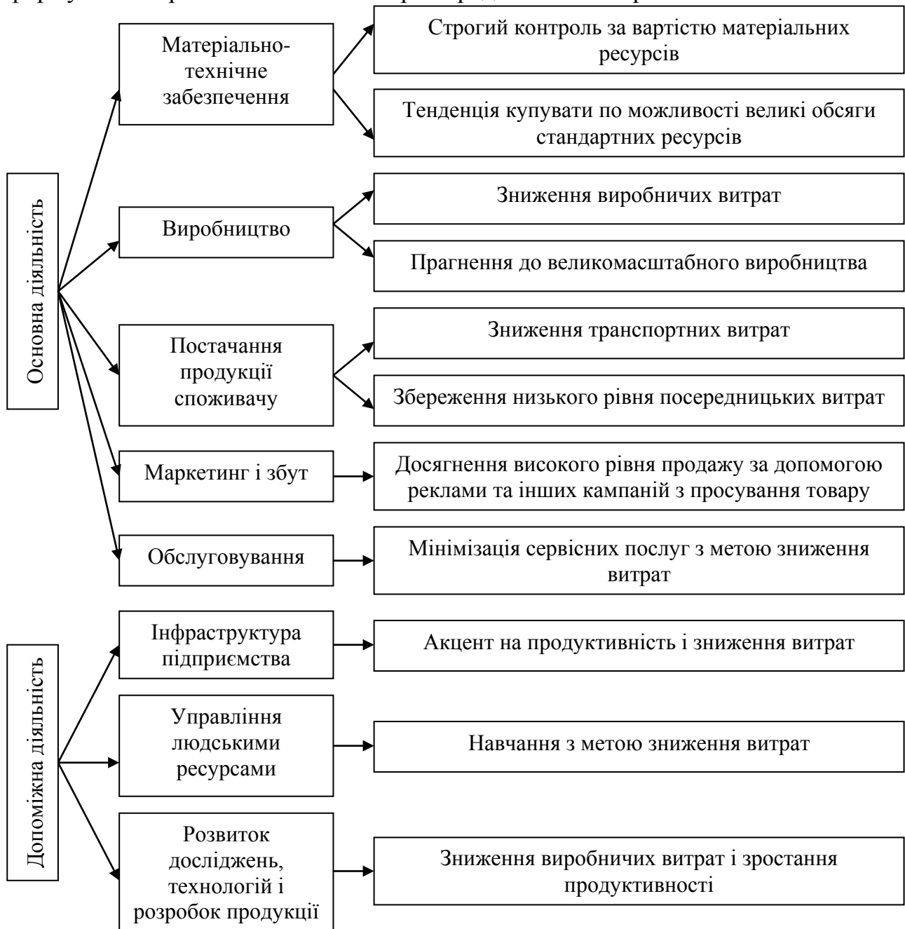
Рис. 3. Співвідношення між ключовими компетенціями та ланками вартісного ланцюга хлібопекарського підприємства

На основі стратегічної концепції вартісного ланцюга та виявлених можливостей щодо зниження витрат можна створити ключові компетенції у сфері матеріально-технічного постачання, виробництва, збуту продукції та іншій допоміжній діяльності підприємств. Компетенції, які хлібопекарські підприємства можуть розвивати й перетворювати їх у ключові компетенції при здійсненні основної та допоміжної діяльності вартісного ланцюга при формуванні стратегії зниження витрат представлено на рис. 3.