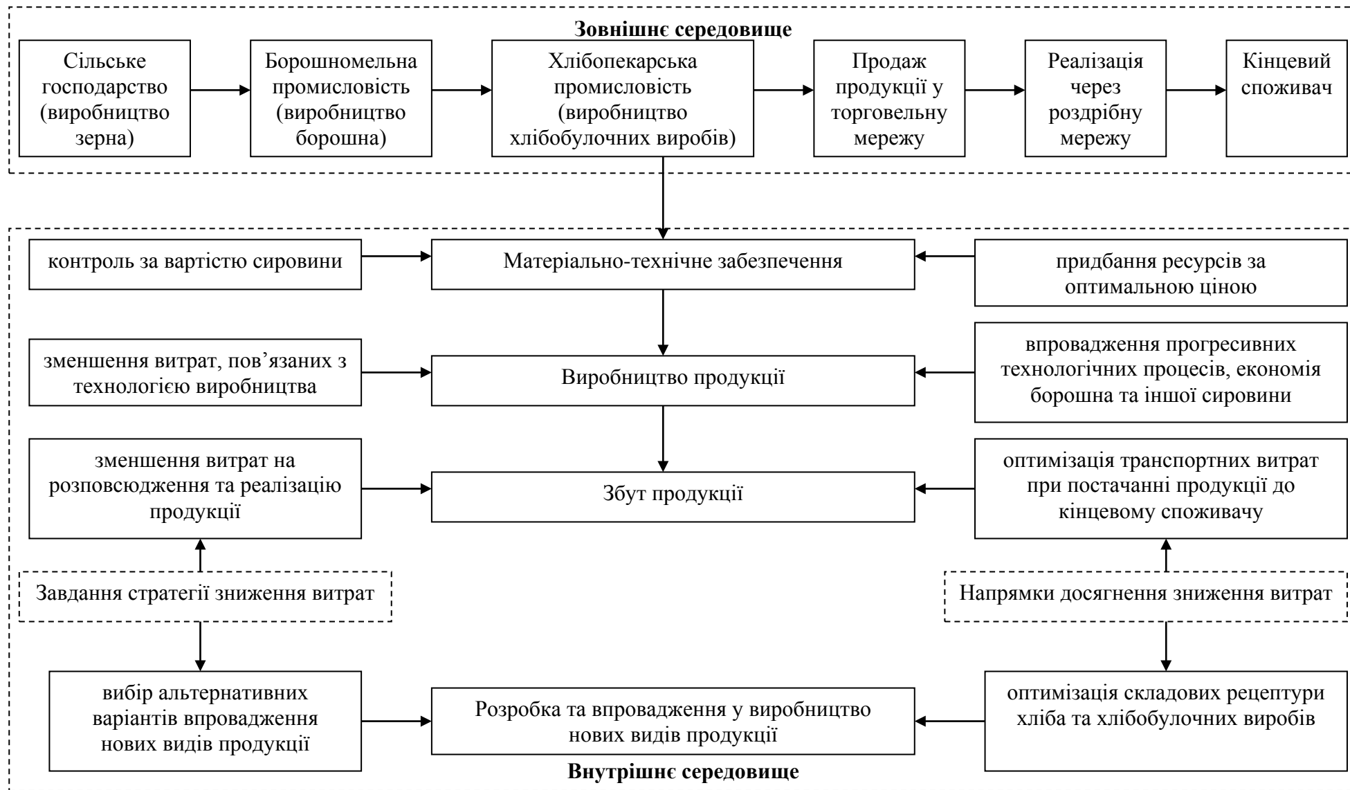
Рис. 2. Стратегічна концепція вартісного ланцюга з виробництва хлібобулочних виробів