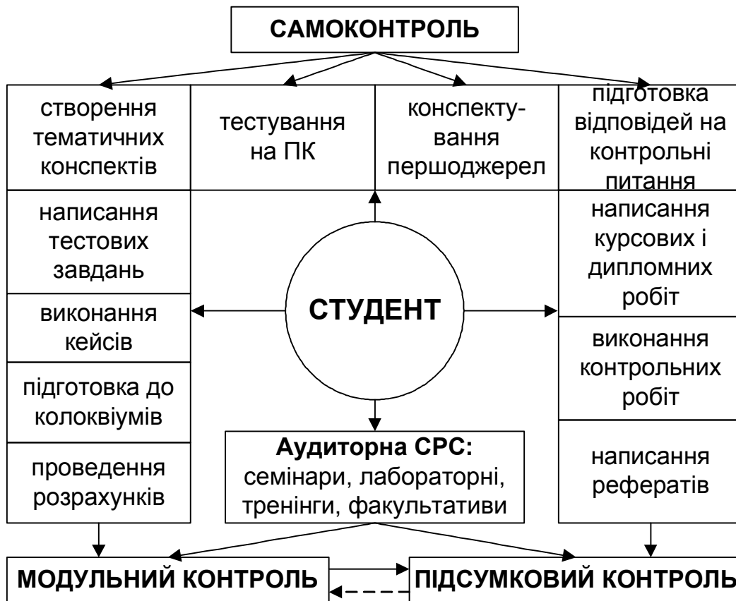
Рис. 2. Структура СРС та системи її контролю у ВНЗ

інформаційну базу самоосвіти (скажімо, при телеуніверситетах функціонують електронні бібліотеки); по-четверте , кожному слухачу регулярно отримувати індивідуальні консультації від досвідчених викладачів; по-п'яте , у ситуації перманентної кризи і породженого нею обмеженого фінансування науково-дослідної діяльності відряджати до національних і зарубіжних наукових центрів викладачів для особистої участі в конференціях, симпозіумах, семінарах тощо; долучити їх до відео-конференцій, on-line обговорень у рамках заданої проблематики в режимі "круглих столів" та ін.; по-шосте , задіювати до викладання і спілкування TV та інші мультимедійні технології не лише штатних викладачів певного ВНЗ, а й громадсько-політичних діячів, митців, літераторів, високопрофесійних практиків, бізнесменів, потенційних роботодавців та інших цікавих осіб.